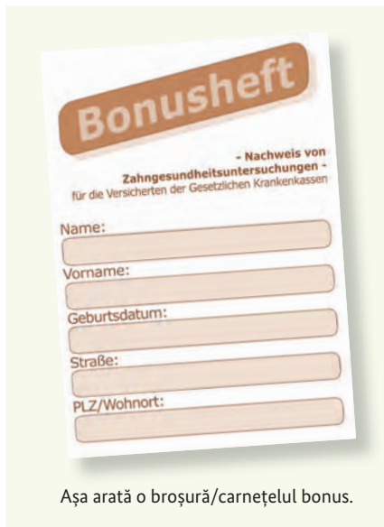
Așa arată o broșură/carnețelul bonus.

Dinții sănătoși sunt un fragment din calitatea vieții. De aceea sunt importante consulturile regulate – chiar dacă nu aveți plângeri. Casele de sănătate obligatorii preiau și costurile acestor consultații preventive. Aceste investigații ajută la recunoașterea și tratarea din timp a anumitor îmbolnăviri. Pentru acest lucru puteți primi un așa-numit „Bonusheft/Carnet bonus“ din partea casei dumneavoastră de sănătate. În acest caiet se înregistrează consultații regulate. Dacă puteți dovedi că ați consultat minim o dată pe an (sub 18 ani minim o dată la jumătate de an) un dentist, casa de sănătate vă plătește o subvenție mai mare în cazul în care devine necesară o proteză.