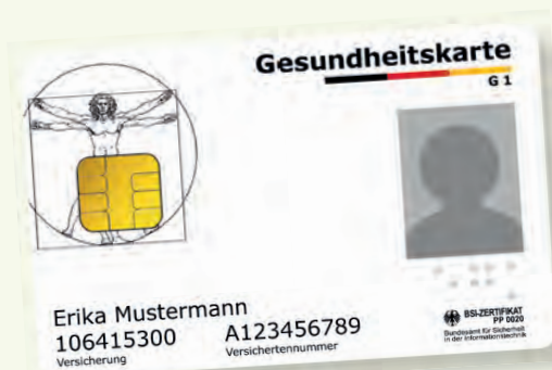
Exemplu model al unui card de sănătate

Va rugăm să aveți cardul electronic de sănătate permanent la dumneavoastră, când utilizați serviciile de sănătate. Începând cu 1 ianuarie 2015 acest card este exclusiv valabil ca dovadă de autorizare pentru a putea beneficia de serviciile asigurării de sănătate obligatorie. Pe cardul electronic de sănătate sunt salvate ca date obligatorii numele, data nașterii și adresa dumneavoastră cât și numărul dumneavoastră de asigurat medical și situația dumneavoastră de asigurat (membru, asigurat al familiei sau pensionar). Cardul electronic de sănătate conține și o fotografie cu dumneavoastră.